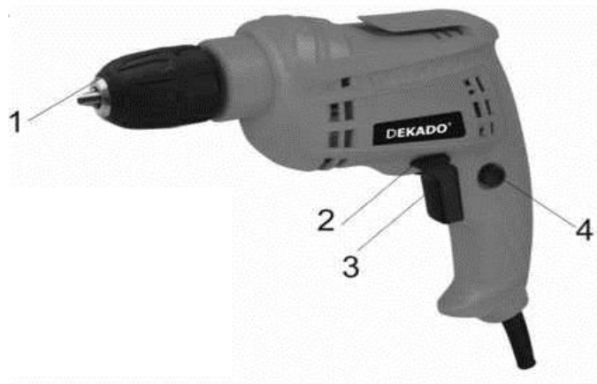
Рис. 1 Дрель электрическая.

В комплект поставки входят: Электрическая дрель - 1 шт. Патрон сверлильный - 1шт. Инструкция по эксплуатации - 1 шт.